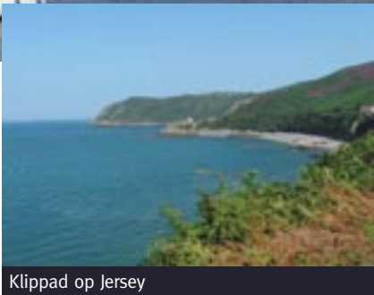
Klippad op Jersey

Zuinig of verstandig: vroeger zouden we er langer over denken maar na diverse horrorverhalen van vrienden in potdichte mist gaan we voor veilig en kopen een radar/kaartplotter. Tenslotte is het Kanaal het drukst bevaren gedeelte van de Noordzee waar het weer veranderlijk is.