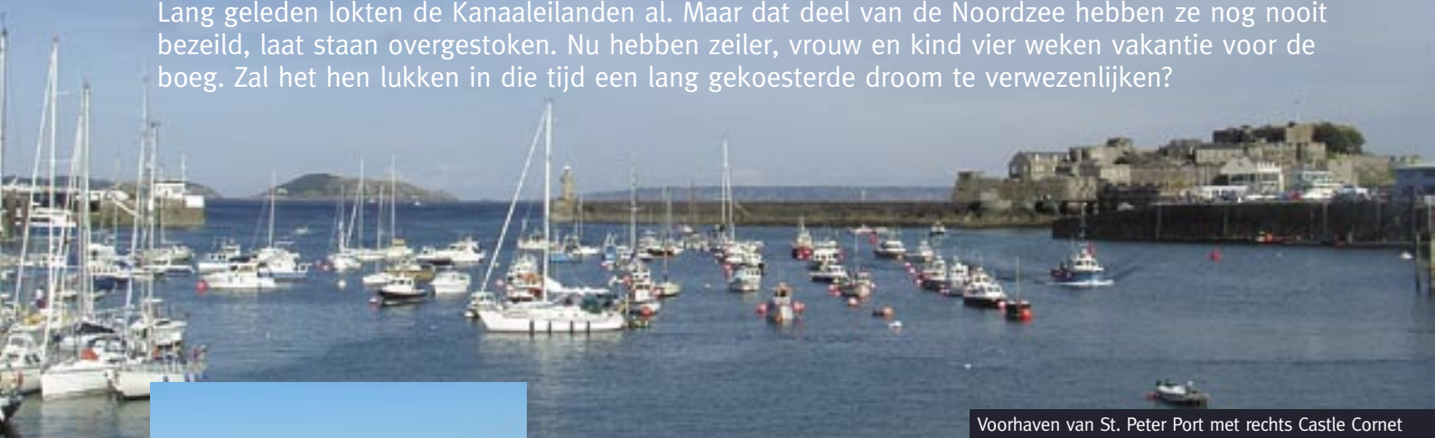
Voorhaven van St. Peter Port met rechts Castle Cornet

Lang geleden lokten de Kanaaleilanden al. Maar dat deel van de Noordzee hebben ze nog nooit bezeild, laat staan overgestoken. Nu hebben zeiler, vrouw en kind vier weken vakantie voor de boeg. Zal het hen lukken in die tijd een lang gekoesterde droom te verwezenlijken?