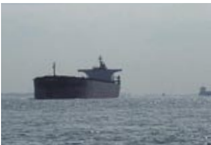
Bij de Nieuwe Waterweg is het altijd opletten

Onderweg botst een Nederlands zeiljacht tegen een Belgische sportvisser. De discussie via de marifoon tussen politie, havendienst, visser en Nederlander is vermakelijk. Voor Oostende krijgen we met een nieuw fenomeen te maken: dobberen voor rood licht. Dit International Port Traffic SYstem (IPTs) regelt het